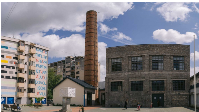
Slika 3. Kulturna stanica svilara

Od svih infrastrukturnih projekata koji su objekti kulturnog nasleđa, koji su se našli u konačnoj i nagrađenoj aplikacionoj knjizi, najuspešnija je realizacija bojadisaone stare svilare, koja je obnovljena i prenamenjena u Kulturnu stanicu „Svilara“, i početak obnove fabričkih paviljona nekadašnje fabrike „Petar Drapšin“ koji su prenamenjeni u kreativni distrikt. Objekat bojadisaone je obnovljen kroz proceduru tekućeg održavanja, ali i drugih formalno fleksibilnih procesa koji su omogućili brzu pripremu projekta obnove i početka obnove. U projekat je uključeno nekoliko elemenata koji su objekat učinili pogodnijim za programske formate koji su unapred definisani kroz posebna istraživanja, odnosno od praktično dve prostorije, napravljeno je nekoliko dodatnih, smanjenjem visine bojadisaone i formiranjem velike sale u prizemlju (sa tonskim studijom na mezaninu) i male sale na spratu. Zadržani su svi elementi koji su objekat činili karakterističnim i vrednim, u relativno malom fundusu objekata industrijskog nasleđa Novog Sada i to: dimnjak, obrada fasada, i u enterijeru koji je po svemu pratio duh nekadašnjeg fabričkog pogona (primena natur betona, vidljivu metalnu konstrukciju, vidljivu strukturu stare konstrukcije i opeke, i drugo).