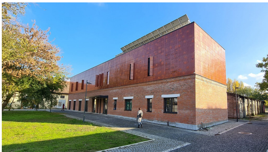
Slika 4. Renovirani objekat u Kineskoj četvrti