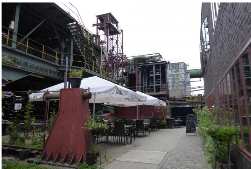
Slika 1. Objekat industrijskog nasleđa u Essen-u adaptiran za potrebe umetnika i razvoj kreativnih industrija

Kulturno nasleđe se smatra nezamenljivim resursom koji može da unapredi socijalni kapital, podstakne ekonomski rast i obezbedi održivost životne sredine. Kultura, uključujući kulturno nasleđe i kreativne industrije, ima važnu ulogu u postizanju inkluzivnog i održivog razvoja. To se odnosi na regeneraciju gradova i regiona u post-industrijskoj eri, kroz kulturno nasleđe, promovisanje adaptivne ponovne upotrebe objekata nasleđa 9 i izbalansiranim pristupom kulturnom nasleđu sa održivim kulturnim turizmom i prirodnim nasleđem.